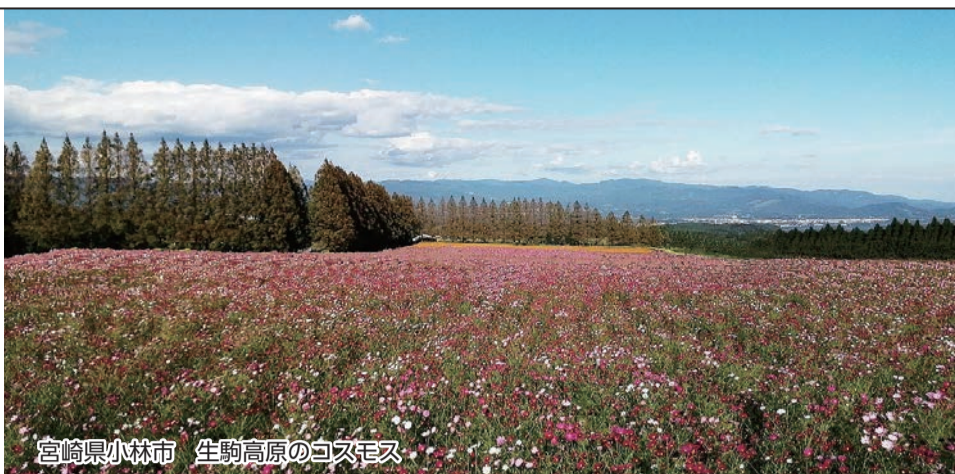
宮崎県小林市 生駒高原のコスモス