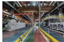
重機工場 成形機組立ライン

完成した機械はお客様の工場や自動車エンジン部品や商用アルミサッシ、生活家電など私たちの暮らしに欠かせない製品を作るために活躍します。