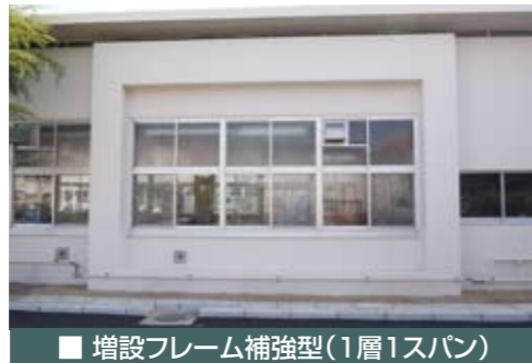
■ 増設フレーム補強型(1層1スパン)