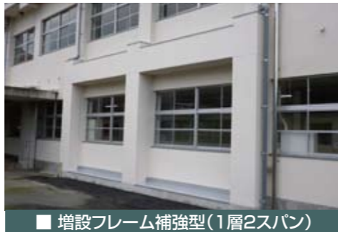
■ 増設フレーム補強型(1層2スパン)